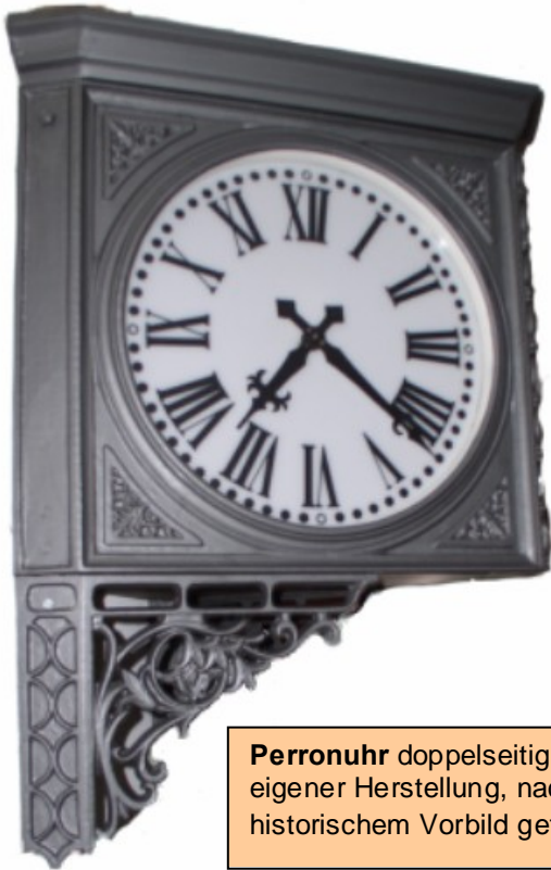
Perronuhr doppelseitig, aus eigener Herstellung, nach historischem Vorbild gefertigt.

Für Plätze, Fußgängerzonen, historische Altstädte, Einkaufspassagen. Ebenso wie für öffentliche Einrichtungen, wie Schwimmbäder, Bahnhöfe usw.