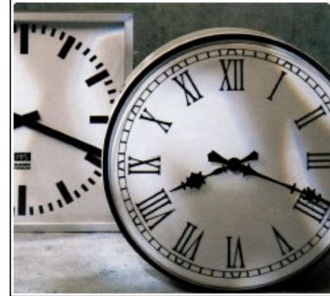
Außenuhren für Wand- oder Deckenmontage, auch doppelseitig.